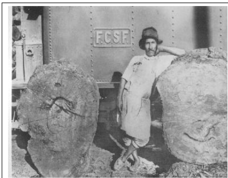
Fig.3: Una imagen paradójica: la riqueza de los bosques y la pobreza de los hacheros

De acuerdo a la crónica de la época, la vida en los obrajes (sitios en los montes donde estaban los hacheros) en algunos casos supera la capacidad del raciocinio humano. Trabajaban hasta la extenuación, suplieron con vino, caña quemada y grapa lo magro de los salarios, vivían en cuevas, que tapadas con ramas les servían de viviendas y las condiciones sanitarias que prevalecían, hacía que pocos de ellos superara los cuarenta años de vida. (Fig.3)