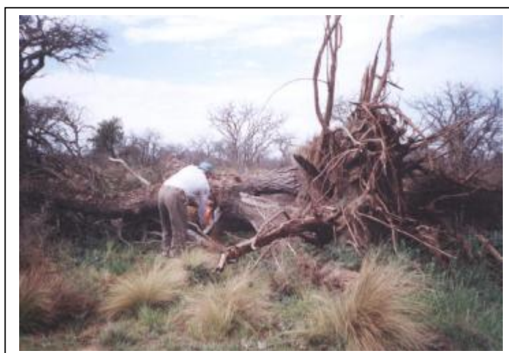
Fig.4. Tala irracional del bosque de caldén en el sur de San Luis.

De acuerdo a estudios preliminares realizados por Maceira et al. (2002) en el sur de la provincia de San Luis, determinaron una tasa de deforestación de 12.638 hectáreas anuales de bosque de caldén, lo que significa una pérdida del 1,8% de la superficie total ocupada por esta especie en la provincia, valores similares a la tasa de deforestación de los bosques tropicales, los ecosistemas más amenazados en el mundo, en este momento. (Fig.4)